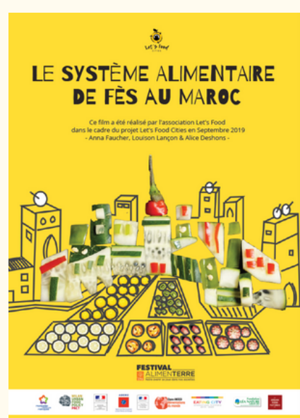
Le système alimentaire de Fès au Maroc, 2019